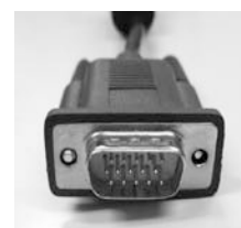
D-sub 15ピンのコネクタ形状 (参考)